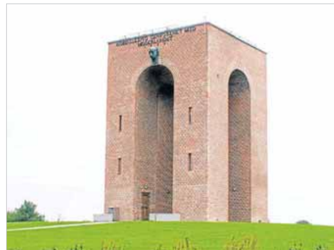
Falkenløwe har bl.a. leveret mursten til Ejer Bavnehøj-bygningen.

Murstenene fra Falkenløwe er primært målrettet til bygninger fra før 1965. På det tidspunkt blev ringovne erstattet af tunnelovne på tegl-